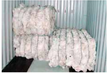
Hleðsla í gáma til útflutnings.