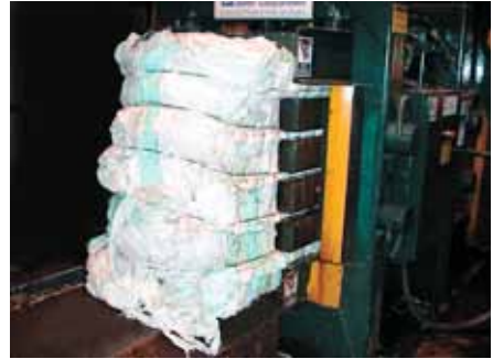
Pressun til útflutnings.