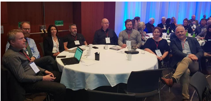
Fulltrúar Skútustaðahrepps og Þingeyjarsveitar ásamt starfsmönnum Sambandsins á fjármálaráðstefnunni.

strax í samræmi við 2 mgr. 53. gr. skipulagslaga nr. 123/2010 þar sem ljóst þykir að þær eru hvorki í samræmi við gildandi skipulag né þá framkvæmd sem sótt var um þann 24. október 2018. Jafnframt var óskað eftir nánari upplýsingum frá stjórn Neyðarlínunnar um málið. Jafnframt var lagt fram svarbréf Neyðarlínunnar dags. 1. okt. 2019. Að mati sveitarstjórnar eru svör Neyðarlínunnar ohf. ófullnægjandi. Sveitarstjórn samþykkti að afturkalla útgefið framkvæmdaleyfi fyrir framkvæmdum við heimarafstöð við Drekaþgil nærri Öskju. Jafnframt skal Neyðarlínan ohf. leggja fram uppfærð gögn vegna framkvæmdarinnar og sækja um nýtt framkvæmdaleyfi. Jafnframt verður óskað eftir afstöðu Vatnajökulsþjóðgarðs og forsætisráðuneytis vegna þeirrar stöðu sem upp er komin.