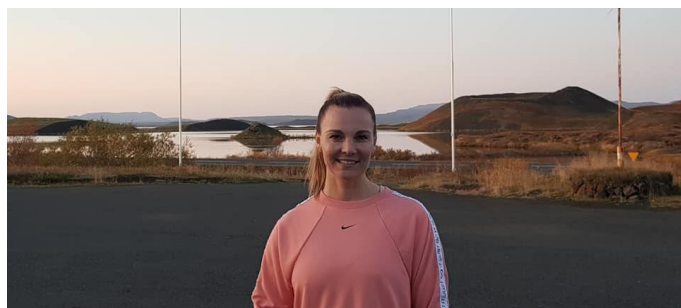
Vilborg fyrir utan Skjólbrekku.