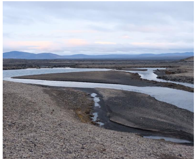
Frá framkvæmdasvæðinu við Drekaðil þar sem myndast hefur talsvert lón fyrir ofan stífluna. Myndin var tekin í síðustu viku.