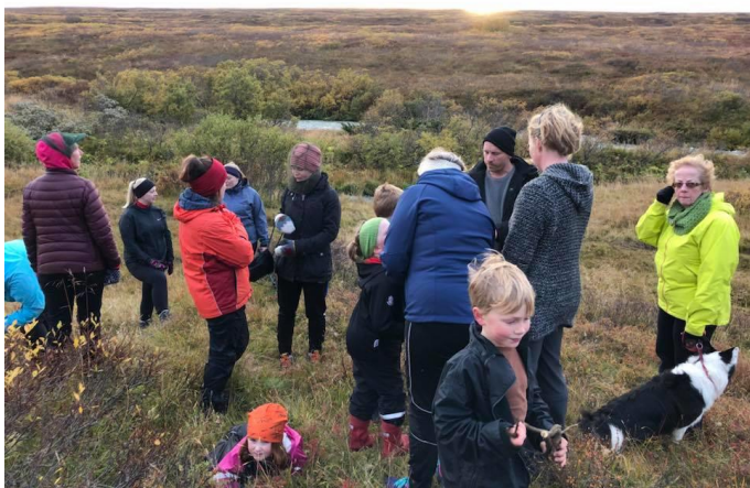
Frá göngunni í gær um Hofstaði.

Sveitarstjórn samþykkti samhljóða tillögu velferðar- og menningarmálanefndar. Tillaga að stýrihóp og kostnaðaráætlun verði lögð fyrir næsta fund nefndarinnar.