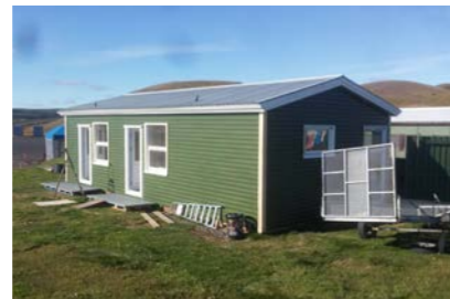
15: Snyrtingahús 60m 2