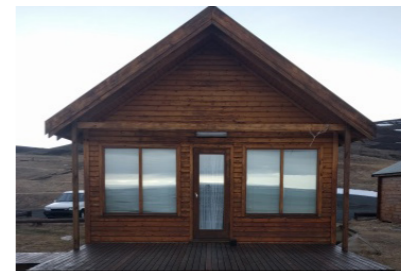
18: Sumarhús - Nýhóll 49m 2 Gistipláss fyrir 3-5 manns