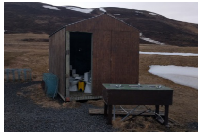
24: Geymsluhús 20m 2