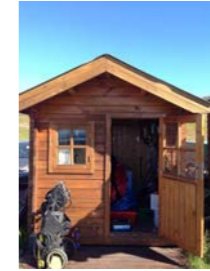
19: Geymsla 4m 2