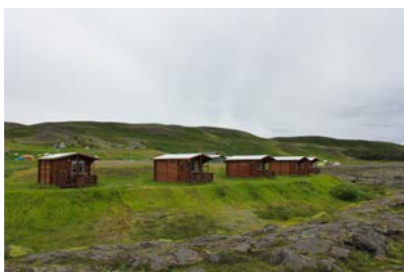
8-13: 6 Gistihús - Kytrur 9m 2 x 5 + 15m 2 x 1 = 60m 2 Gistipláss fyrir 14 manns