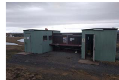
23: 2 Snyrtingahús - Grænu 11m 2 x 2 = 22m 2