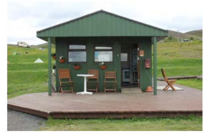
17: Afgreiðsluhús - Varðberg 32m 2