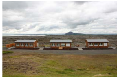
1-3: Gistihús - Andabyggð 54m 2 x 3 = 162m 2 Gistipláss fyrir 18 manns