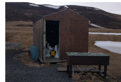
24: Geymsluhús 20m 2