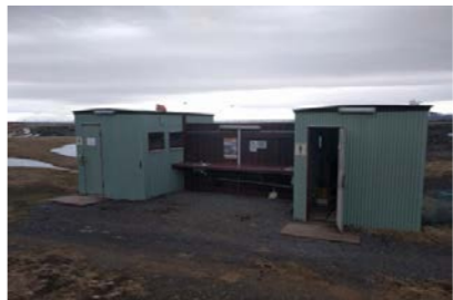
23: 2 Snyrtingahús 11m 2 x 2 = 22m 2