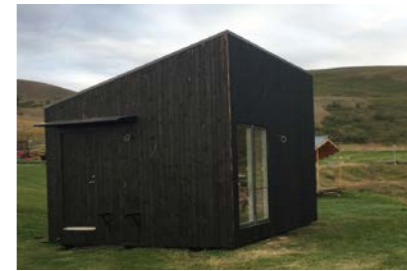
22: Gistihús 27m 2 Gistipláss fyrir 2 manns