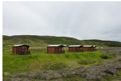
8-13: 6 Gistihús - Kytrur 9m 2 x 5 + 15m 2 x 1 = 60m 2 Gistipláss fyrir 14 manns