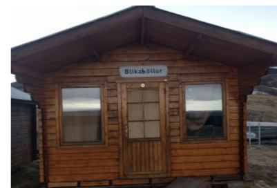
20: Gistihús 21m 2 Gistipláss fyrir 4 manns