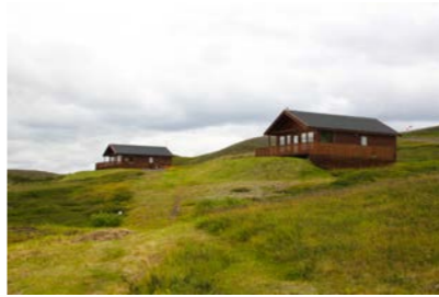
5-6: 2 Sumarhús 49m 2 x 2 = 98 2 Gistipláss fyrir 8-12 manns