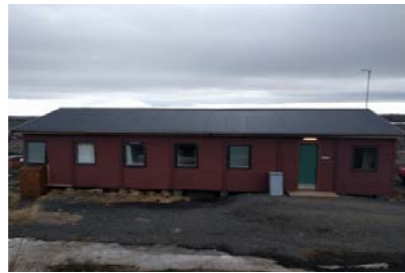
7: Gistihús - Starfsfólk 130m 2 Gistipláss fyrir 16 manns