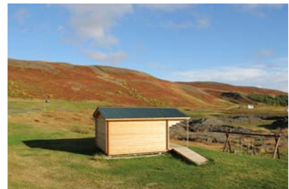
21: Gistihús 15m 2 Gistipláss fyrir 4 manns