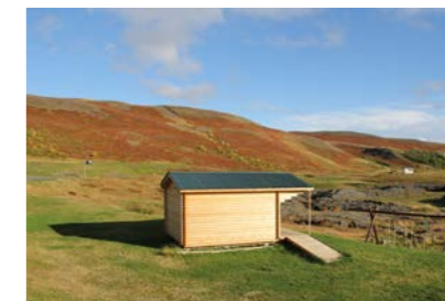
21: Gistihús 21m 2 Gistipláss fyrir 4 manns