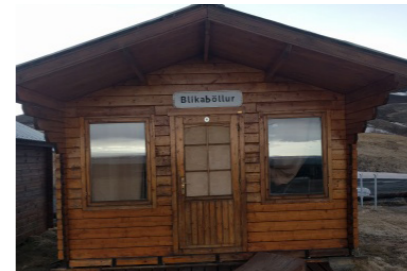
20: Gistihús 15m 2 Gistipláss fyrir 4 manns