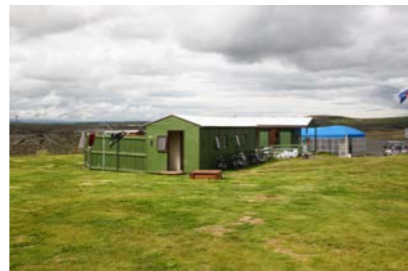
16: Snyrtingahús - BB 27m 2