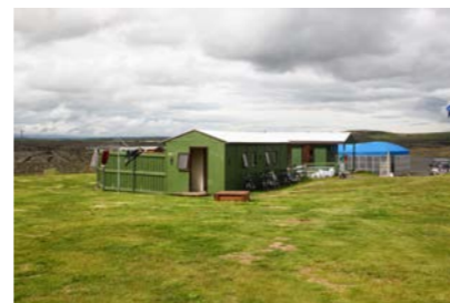
16: Snyrtingahús - BB 27m 2