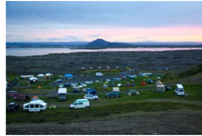
25: Tjaldsvæði 20.540m 2 Gistipláss fyrir ca. 300 manns