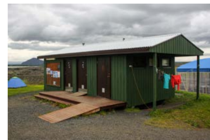
6: Baðhús 32m 2