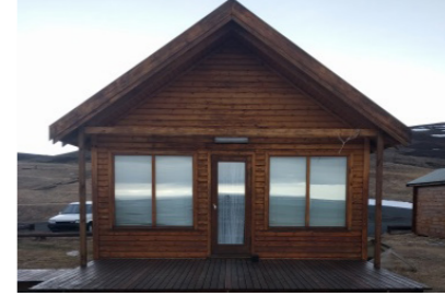
18: Sumarhús - Nýhóll 49m 2 Gistipláss fyrir 3-5 manns