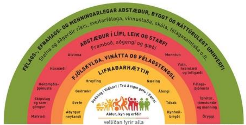
Áhrifþætur heilbrigðis og velliðanar, Dahlgræn og Whitehead (1991), aðlagð útgáfa Embættis Landlæknis 2019 (3.Ú).

Skútustaðahreppur er Heilsueflandi samfélag, en það felur í sér að heilsa og líðan íbúa er í